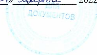
График приема документов детей, поступающих в 1 класс в 2022-2023 учебном году